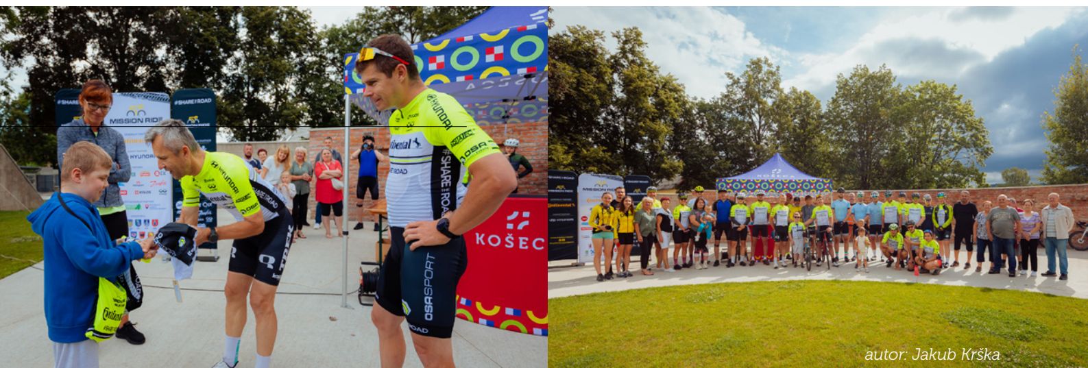
autor: Jakub Krška

Viac informácií o podujatí tu: https://missionride.eu/