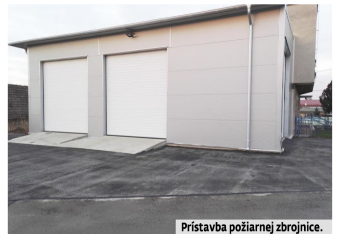
Prístavba požiarnej zbrojnice.

Všetky investície by obec nevládla financovať výlučne z vlastných prostriedkov. Na časť investícií si požičia. Poslanci obecného zastupiteľstva v minulom roku schválili na 4 veľké spomínané investície prijatie úveru vo výške 300-tisíc eur. Pôvodne to malo byť viac. Celková odhadovaná suma predmetných investícií bola predbežne (rozpočtami k projektom a štúdiám) stanovená vo výške viac ako 900-tisíc eur. Už pri prvých dvoch verejných obstarávaníach (ulica Za parkom a most pri ihrisku) sa obci podarilo oproti projektovým cenám obstaráť