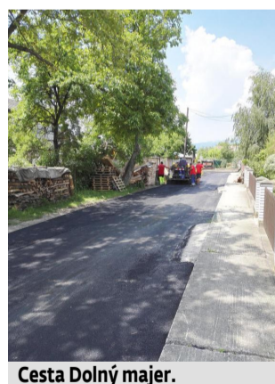
Cesta Dolný majer.

Azda najväčšia finančná čiastka sa za posledné dva roky investovala do prístavby požiarnej zbrojnice. V súčasnosti už DHZ Košeca tieto priestory užíva a jej členovia veľkou mierou prispeli aj sami k tomu, aby sa v novej garáži cítili príjemne. V tomto roku by radi požiadali o dotáciu na rekonštrukciu starej časti zbrojnice. Bude potrebné ju zatepliť, urobiť nové kúrenie, opraviť elektroinštaláciu atď.