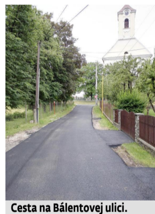
Cesta na Báľentovej ulici.

v súčasnosti vo veľmi zlom stave. Jej súčasťou bude aj nový chodník popri Podhradskom potoku a v určitých častiach aj dažďová kanalizácia. O pár dní by sme mali mať k dispozícii projektovú dokumentáciu pre vybavenie potrebných povolení.